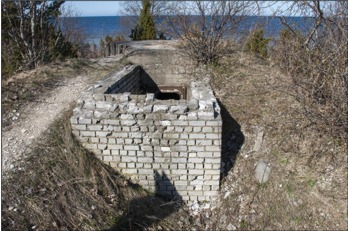
Foto 17. Sarve-Lehtma kaitseliin. Dott [11] Kärldas Rehemäe tee ääres. Tellistest juurdeehitus ja metallist uks lisati 1980. aastatel, kui dotted kasutati tsiviilkaitse õppusteks