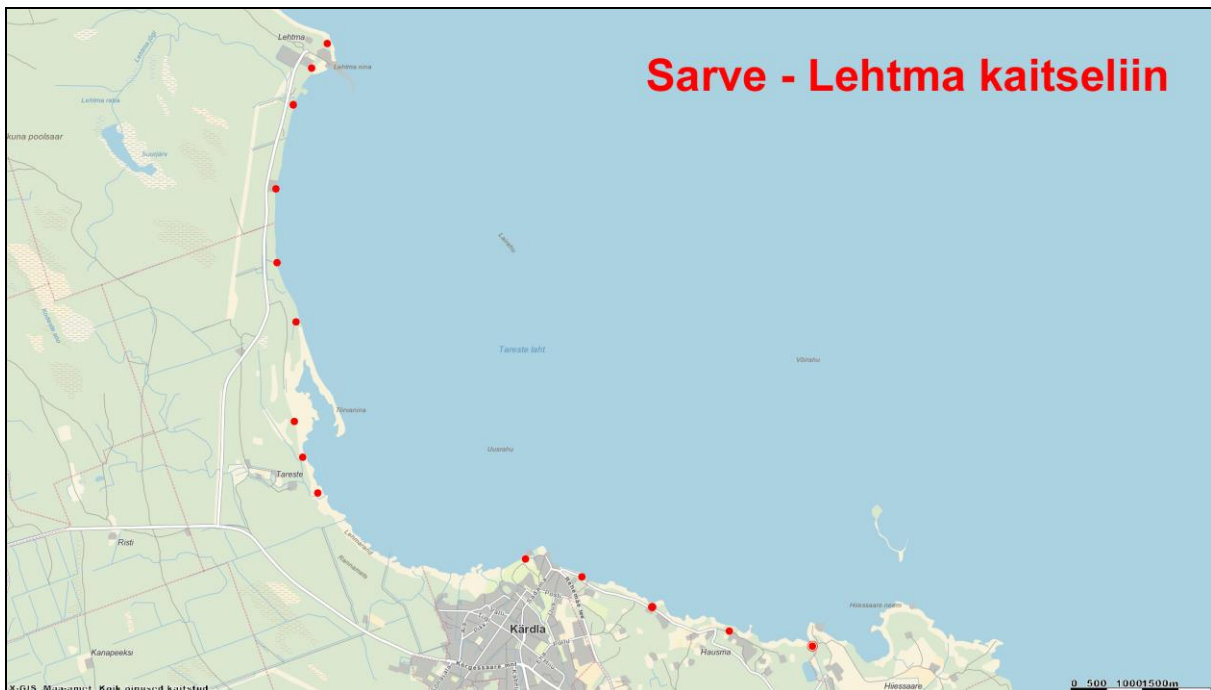
Skeem 3. Sarve-Lehtma kaitseliini põhjapoolsemad dotid 8-21. Aluskaart: Maa-ameti geoportaal