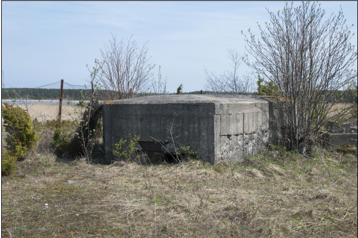
Foto 13. Sarve-Lehtma kaitseliin. Dott [7] Suursadamas kütusehoidla territooriumil.