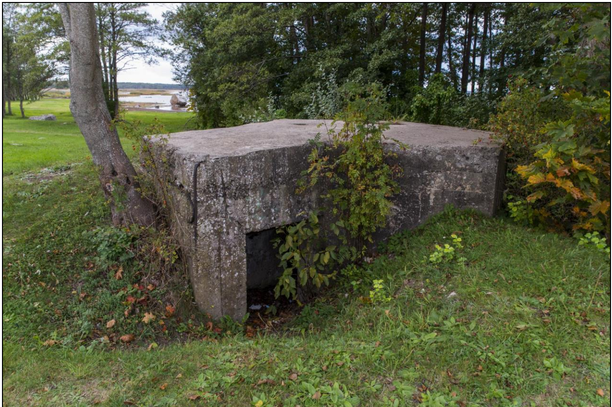
Foto 18. Sarve-Lehtma kaitseliin. Dott [12] Kärldas Rannapaargu juures rannas