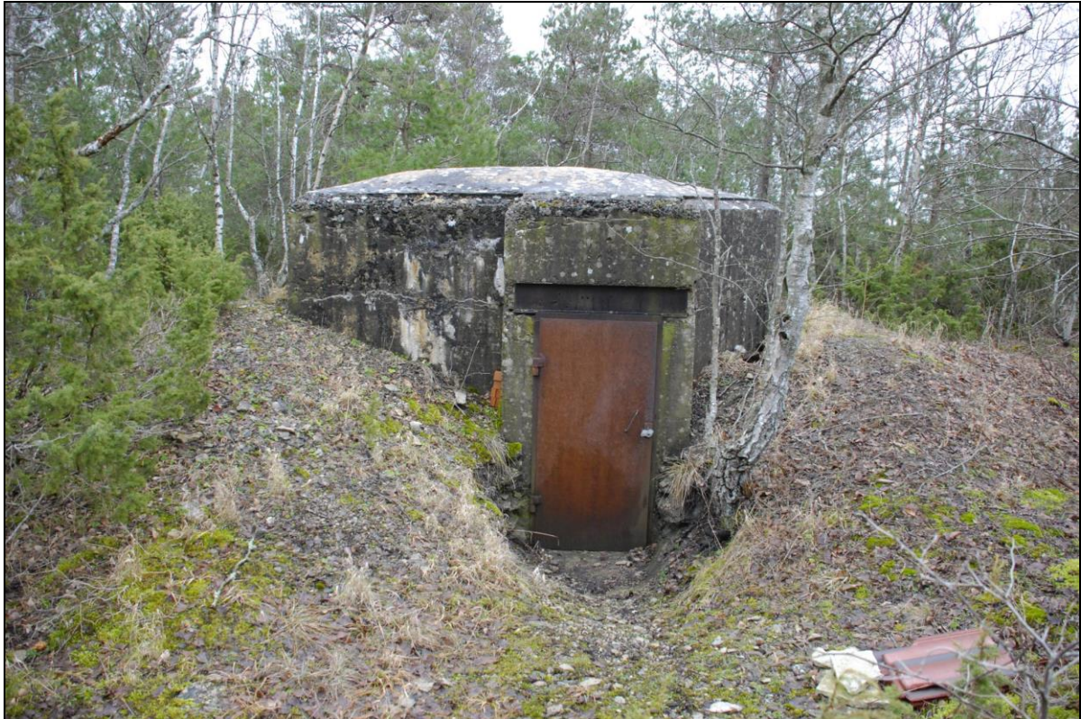
Foto 9. Sarve-Lehtma kaitseliin. Dott [3] Heltermaa sadamast põhja pool