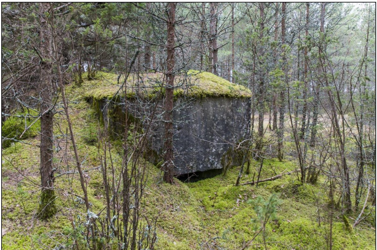
Foto 14. Sarve-Lehtma kaitseliin. Dott [8] Hiessaares lennujaama juures