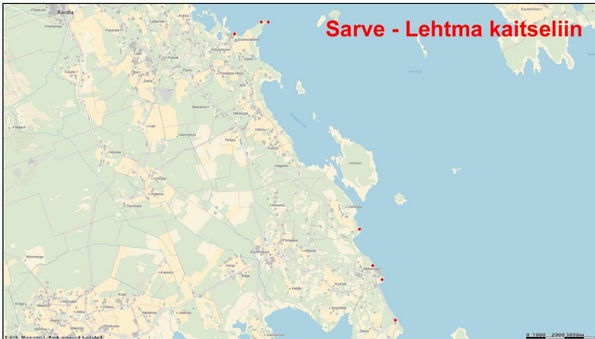
Skeem 2. Sarve-Lehtma kaitseliini lõunapoolsemad dotid 1-7. Aluskaart: Maa-ameti geoportaal