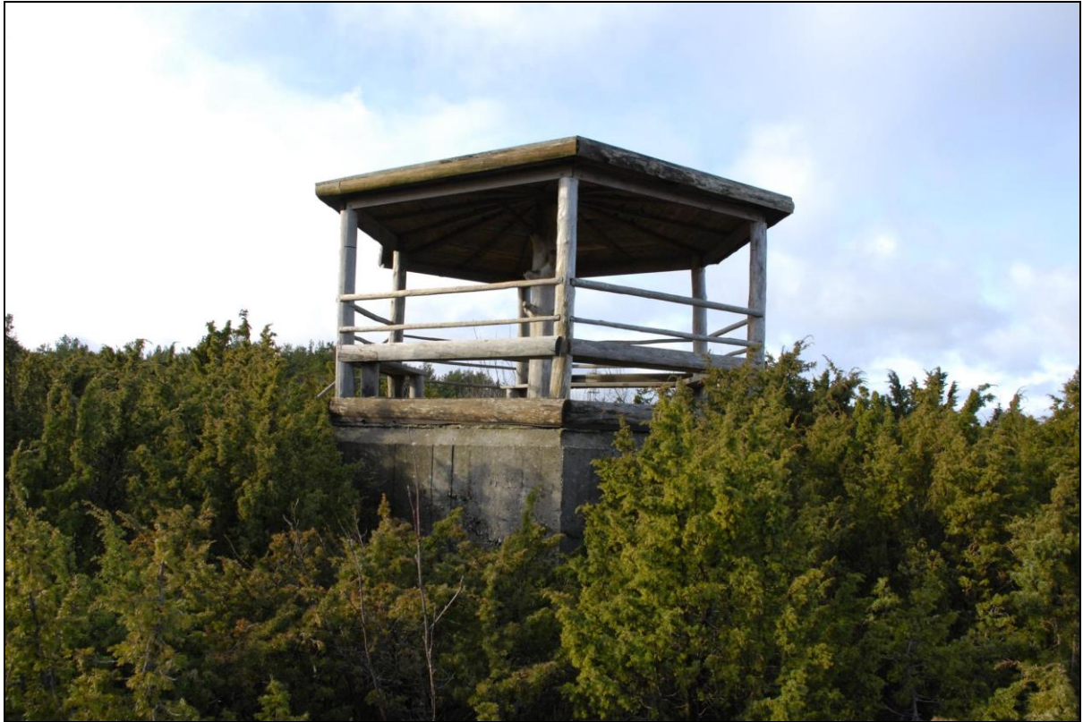
Foto 11. Sarve-Lehtma kaitseliin. Dott [5] Sääre ninal. Doti peale on ehitatud RMK vaateplatvorm.