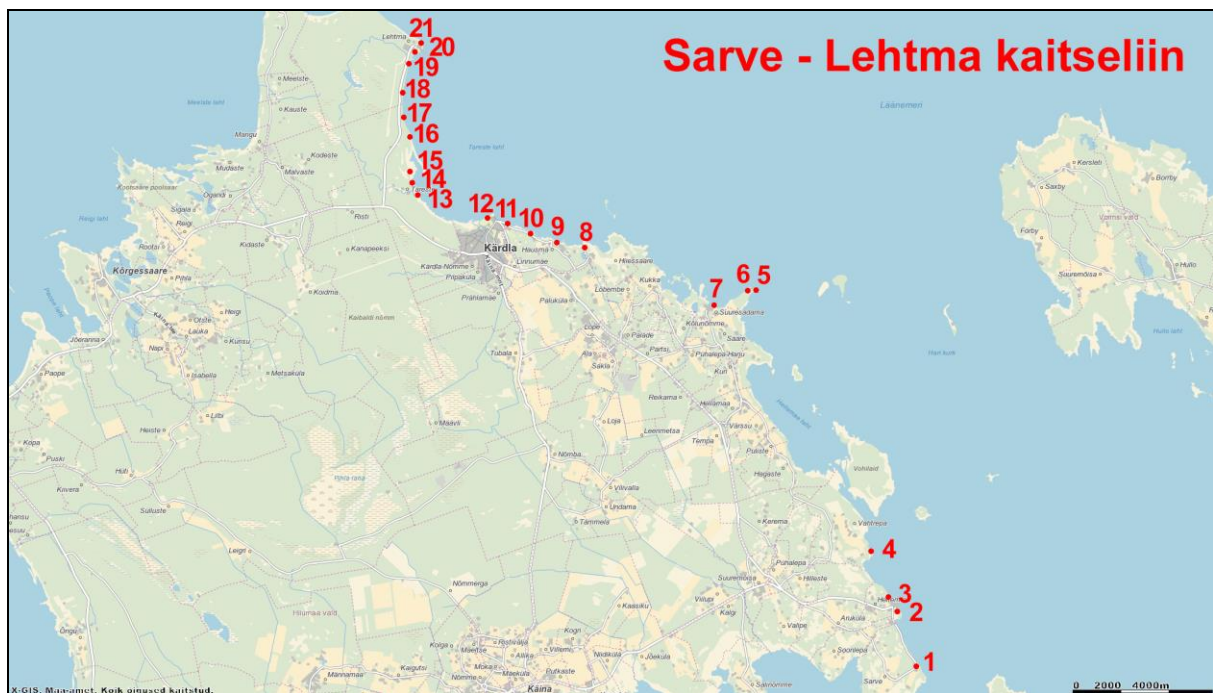
Skeem 1. Sarve-Lehtma kaitseliini dotid. Aluskaart: Maa-ameti geoportaal