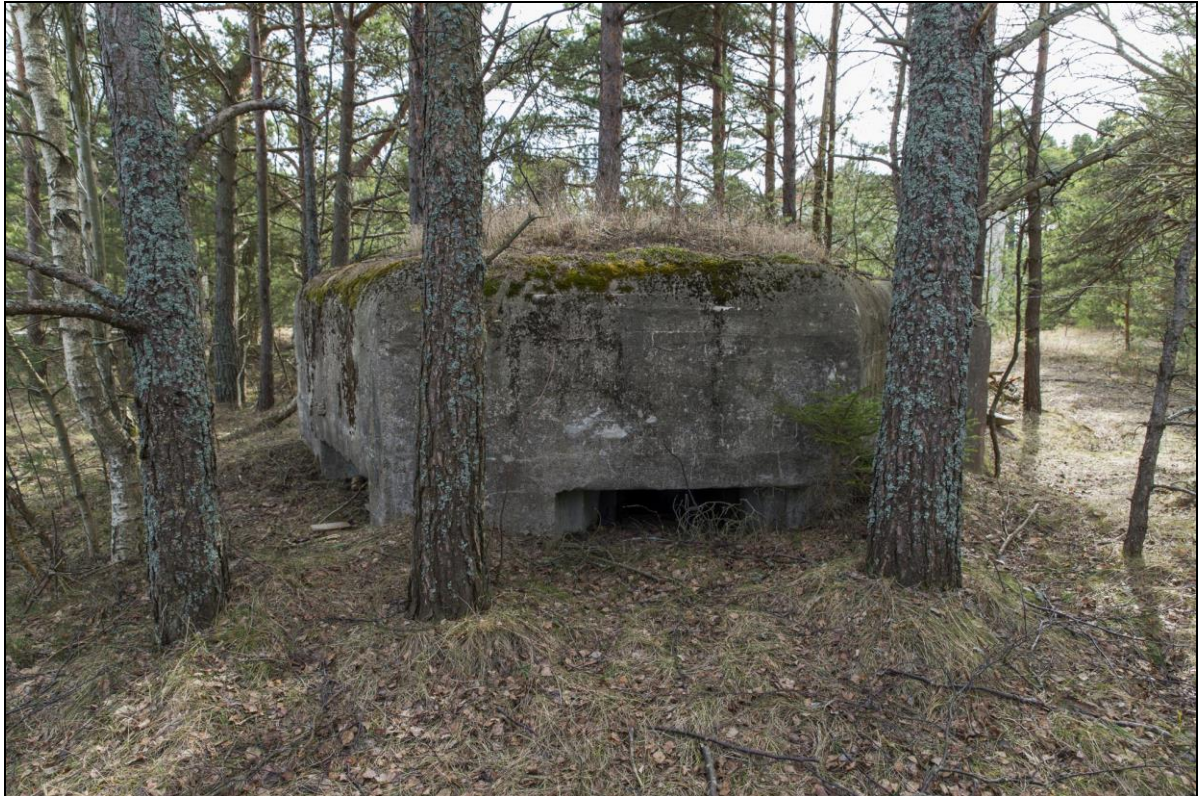
Foto 27. Sarve-Lehtma kaitseliin. Dott [21] Lehtmas piirivalve tehnilise vaatluse posti juures. See dott erineb teistest väga hea ehituskvaliteediga, ka ei ole teistel dottidel ümardatud lae serva. Sarnase ümara servaga on tehtud rannapatareide varjendid.