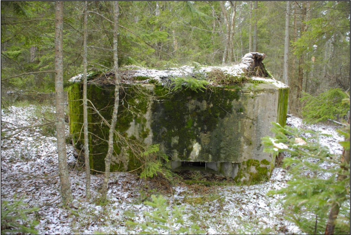
Foto 25. Sarve-Lehtma kaitseliin. Dott [19] Tõrvanina rannas. Sees säilinud metallist laskeava luugid.