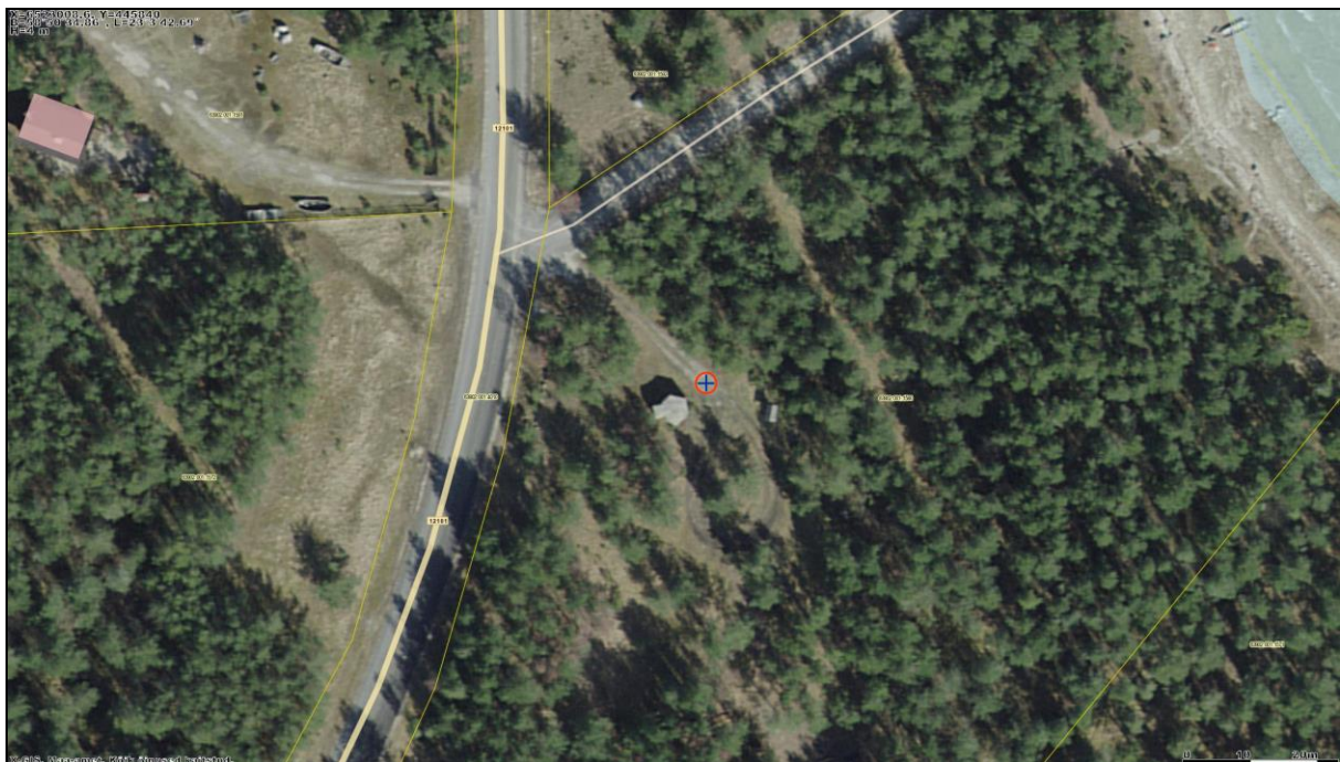
Skeem 5. Sarve-Lehtma kaitseliin. Sarve dott [1] 2014. aasta aerofotol.