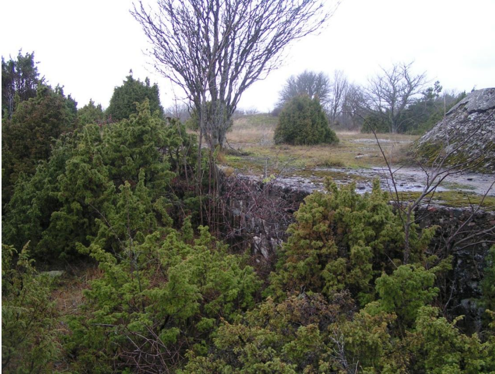
Foto nr 3 Sama, pinnasega katmata vundamendinurk,