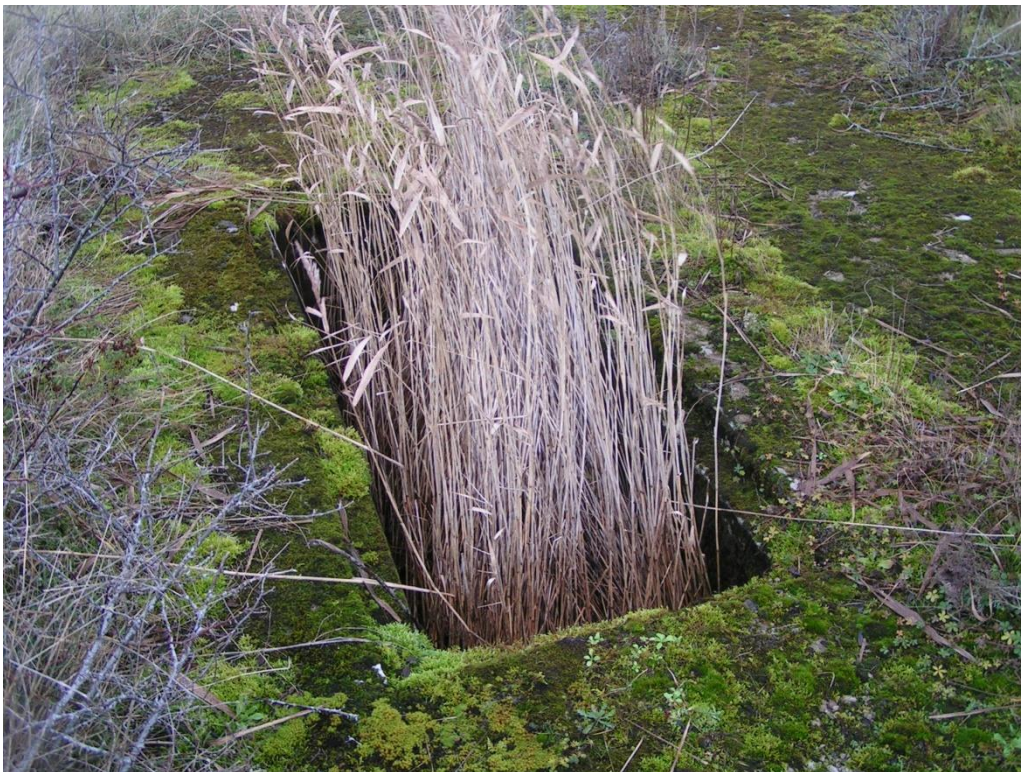
Foto nr 24 Juhtimiskeskusest edelasse jääv generaatorialus. (Vaade lõunast).