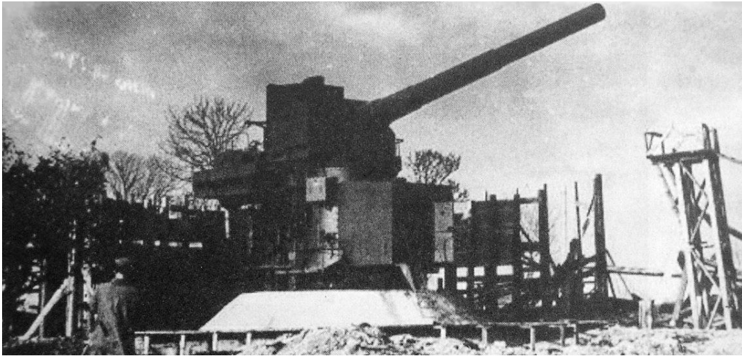
Foto 1. 305 mm rannakaitse suurtükk positsioonil nr 4.