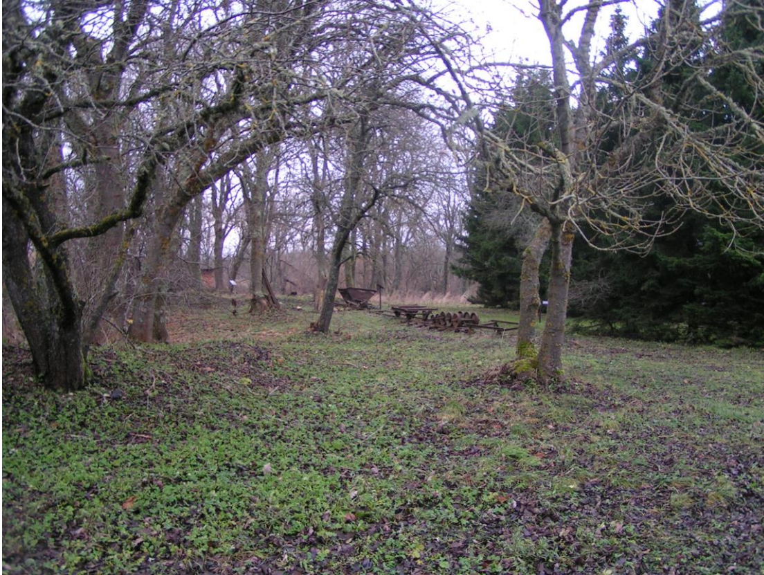
Foto nr 19: Positsiooni nr 4 juures lõppev Mõntu-Sääre raudtee.(Veermik ei ole originaal).