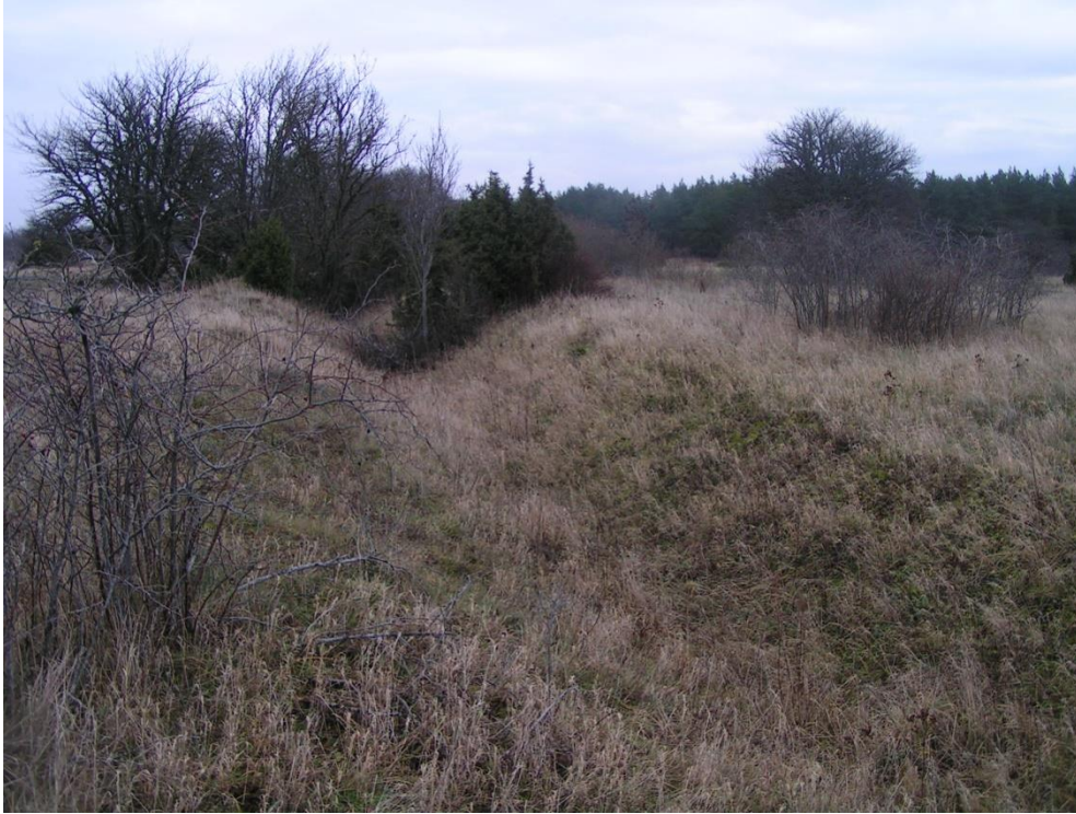
Foto nr 23: Positsioonide 2 ja 3 vahele jääv jooksupuukraav. (Vaade lõunast).