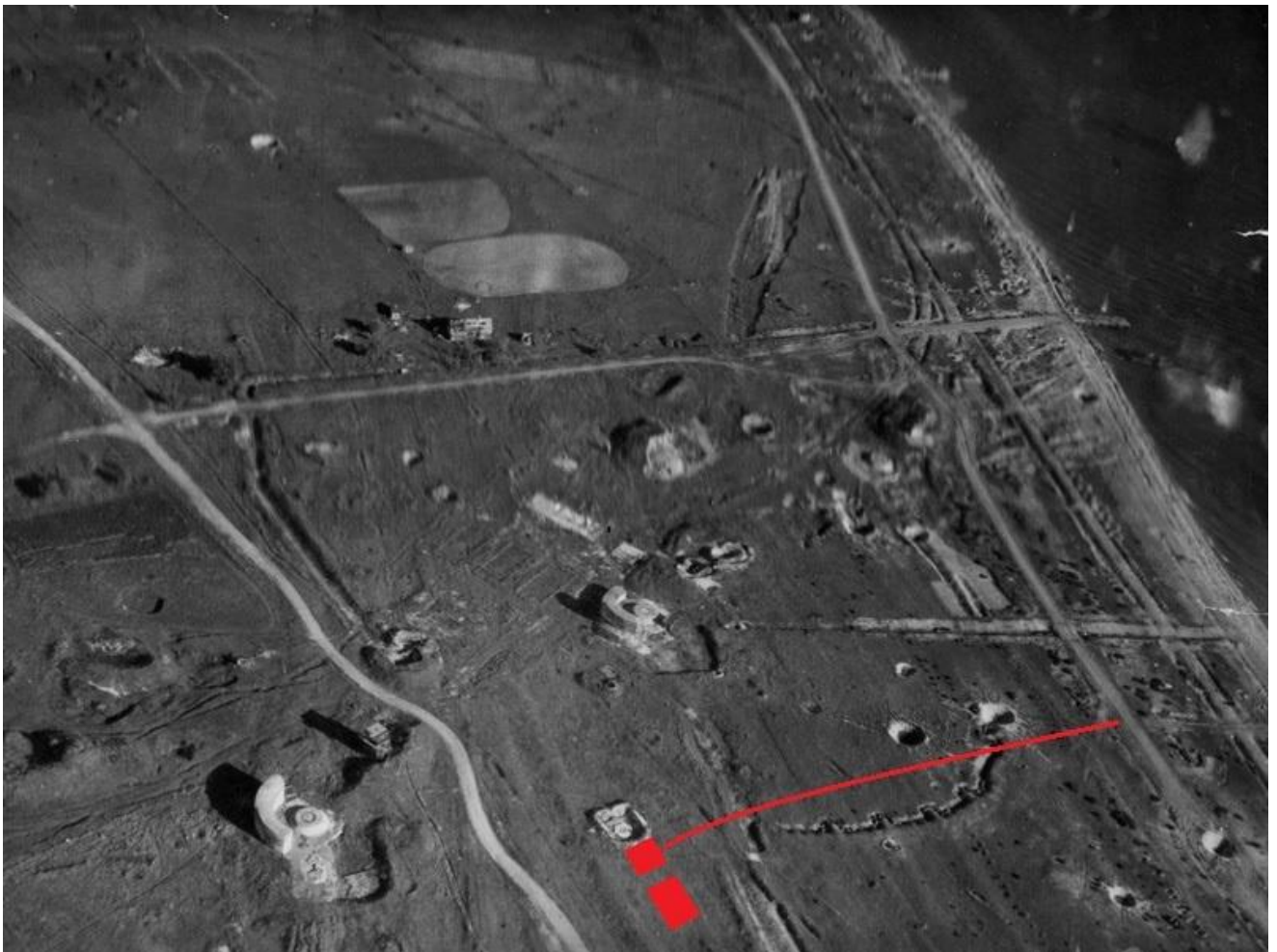
Foto 2. Õhufoto Sääre 305 mm rannakaitse suurtükkide positsioonidest 1944. aastal. Punasega tähistatud mõned aastad tagasi ehitatud saun ja suvila 130 mm suurtükipositsiooni kõrval.