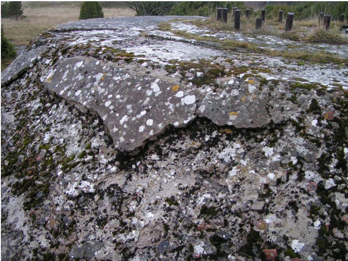
Foto nr 4 Sama, koonuse murenenu pealispind.