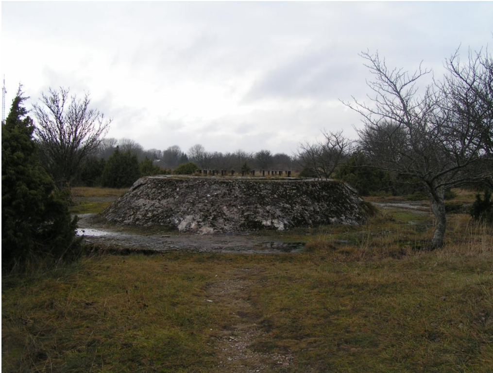
Foto nr 1 Suurtükipositsioon nr 1. Vaade mere poolt.