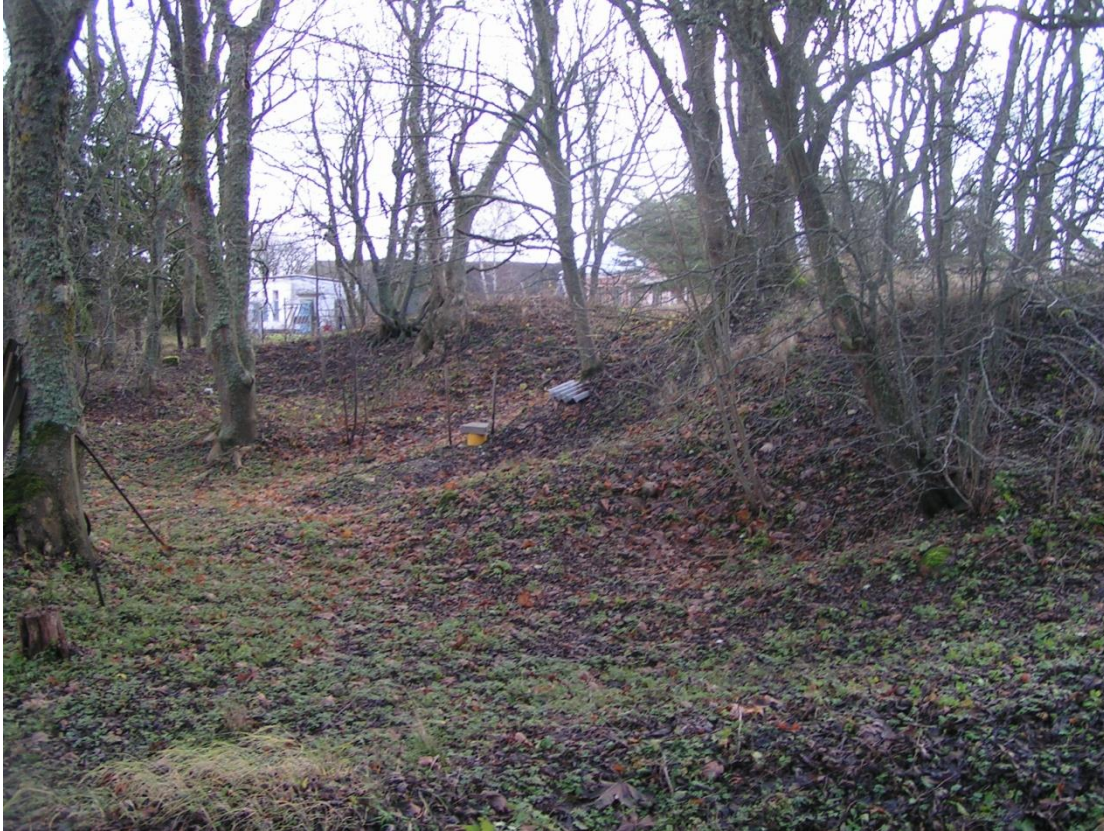
Foto nr 17: Positsiooni nr 4 laskemoonakelder lääne poolt vaadatuna.