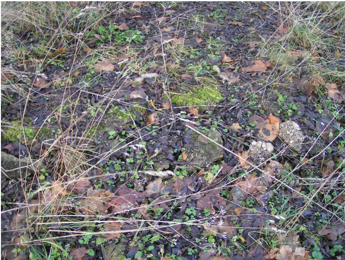
Foto nr 16: Sama, elektrigeneraatori betoonist aluse jäänused suurtükipositsiooni kõrval.