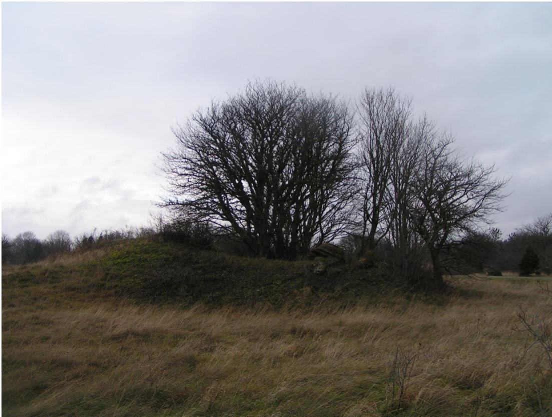
Foto nr 21: Sääre 305 mm suurtükipatarei juhtimispunkt, vaade idast.