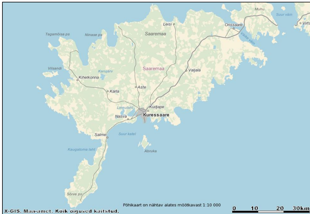
Skeem 1. Asukoha skeem